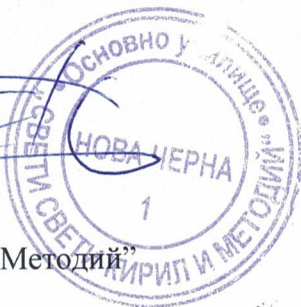
ГРАФИК ЗА РАБОТА НА ГРУПАТА

Директор на ОУ „Свети Свети Кирил и Методий“